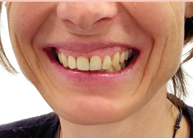
Abb. 6: Patientin mit neuer Frontzahnkrone. Die hohe Lachlinie bedeutete eine Herausforderung für die ästhetische Gestaltung.