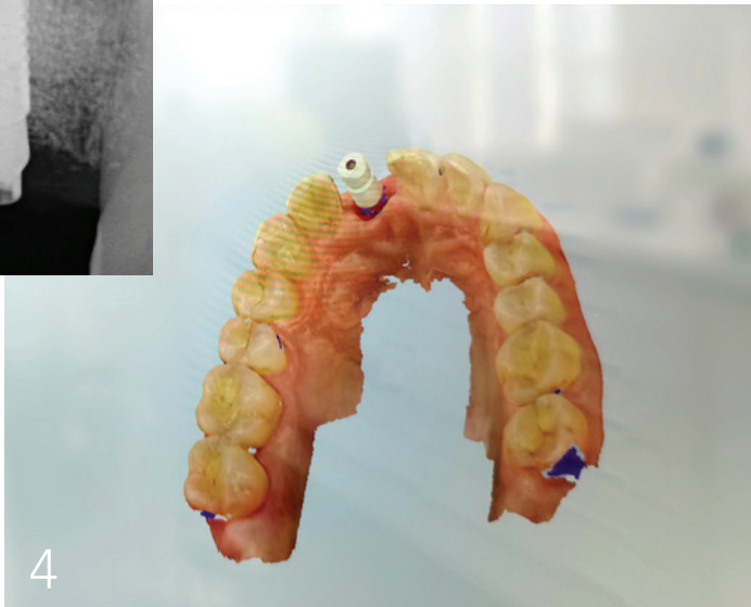
Abb. 4: Intraoralscan mit Scanbody sechs Wochen nach Freilegung.