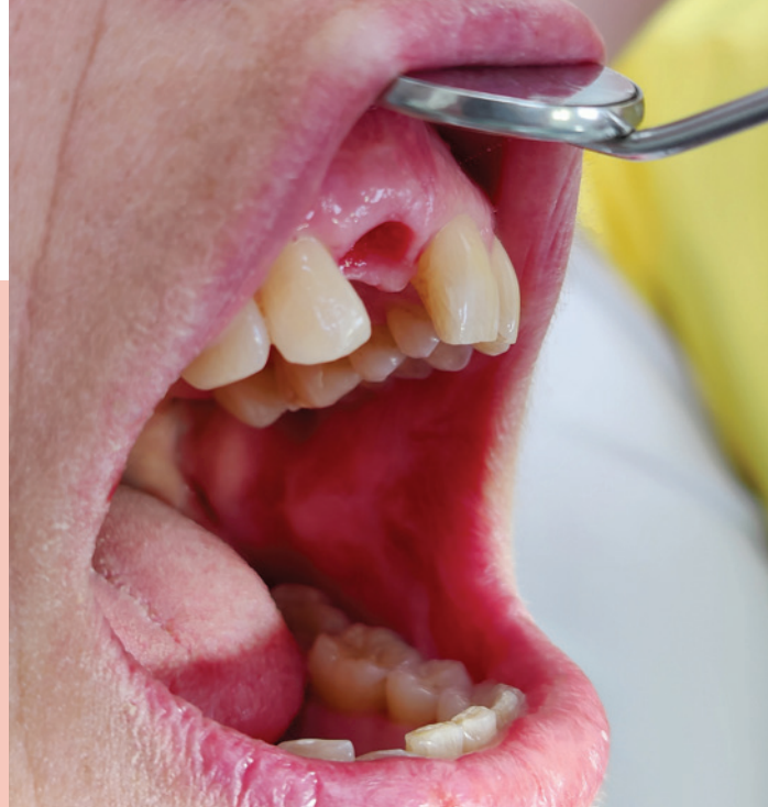
Abb. 5: Gute Ausformung der Gingiva und Ermöglichung eines konvex gestalteten Emergenzprofils innerhalb von sechs Wochen nach Einsetzen der provisorischen Implantatkrone.

Aufgrund des traumatischen Tiefbisses der Patientin brach während Einheilungszeit und Osteointegration mehrfach die Interimsprothese. Deshalb wurde zur Implantatfreilegung eine provisorische Krone als individueller Gingivaformer geplant. Nach der Freilegung wurde das Implantat mit einem Scanbody und optisch elektronischer Abformung (iTero Scanner) gescannt und die Daten ans hauseigene Meisterlabor übermittelt. Innerhalb von zwei Stunden wurde ein hochwertigeres Provisorium designt, gefräst, poliert und umgehend im Mund der Patientin verschraubt. Ein großer Vorteil dieser Lösung: die perfekte Ausformung der Gingiva sowie ein optimales Emergenzprofil in der Folge. Die provisorische Krone war in der Zeit zudem ohne Plaqueablagerungen geblieben – ein Zeichen von sehr guter Mundhygiene. Für die endgültige Versorgung wurde die Zahnfarbe erneut bestimmt. Die Zirkonkrone wurde auf einem individuell hergestellten Zirkonabutment befestigt. Letzteres bietet aufgrund der speziellen Fertigung eine optimale biomechanische Unterstützung, eine bessere Anpassung des Weichgewebes sowie ästhetische Pluspunkte. Aufgrund der Ästhetik und der stärkeren Implantatneigung nach labial wurde die Krone verklebt und nicht verschraubt.